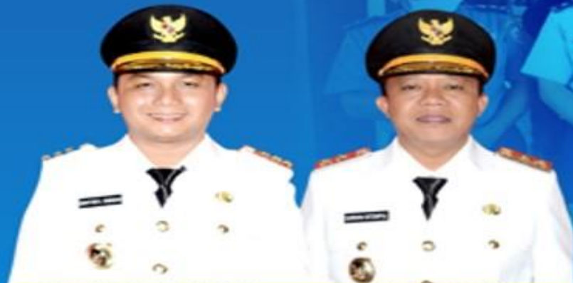
BAKHTIAR AHMAD SIBARANI BUPATI TAPANULI TENGAH

UPDATE DATA PASIEN PADA TANGGAL 3 MEI 2020