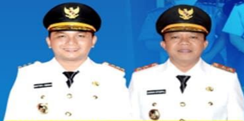
BAKHTIAR AHMAD SIBARANI BUPATI TAPANULI TENGAH

UPDATE DATA PASIEN PADA TANGGAL 21 APRIL 2020